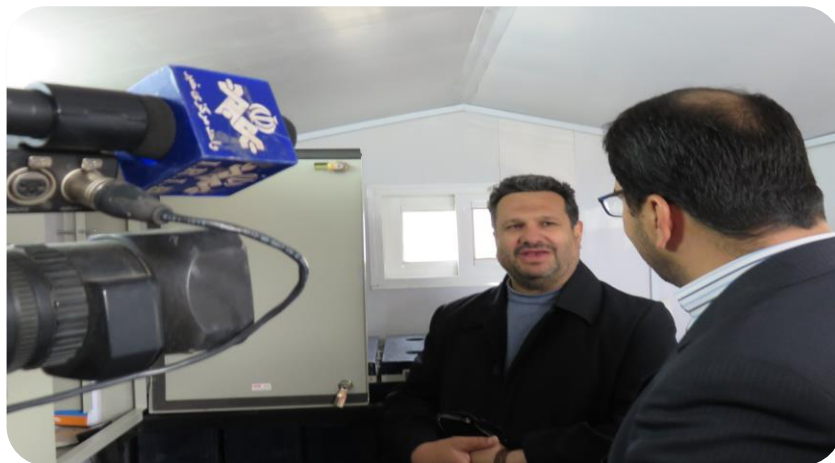
تاریخ بهره‌برداری: زمستان ۱۳۹۳