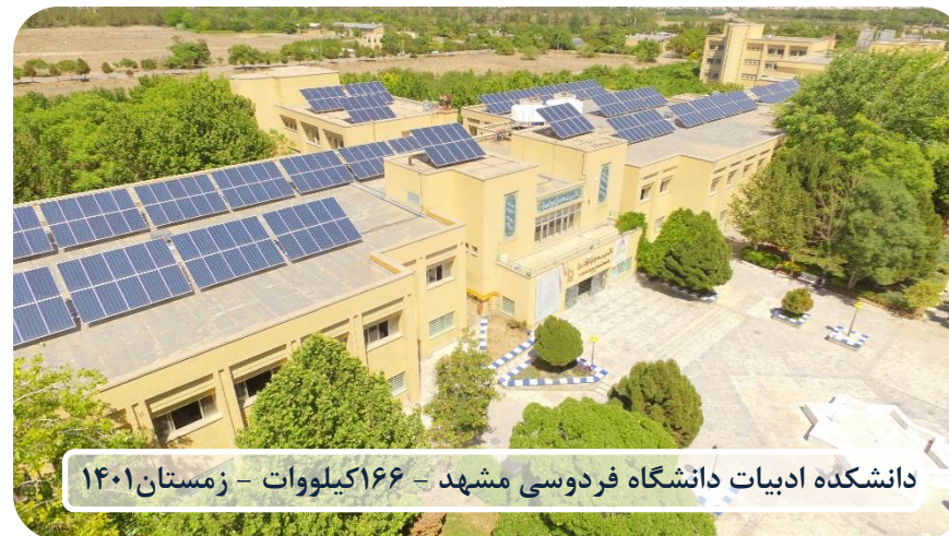
دانشکده ادبیات دانشگاه فردوسی مشهد - ۱۶۶ کیلووات - زمستان ۱۴۰۱