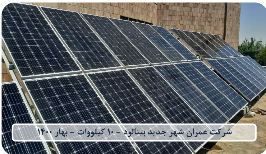
شرکت عمران شهر جدید بینالود - ۱۰ کیلووات - بهار ۱۴۰۰