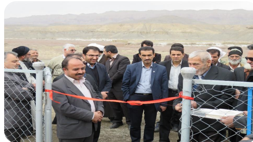
کارفرما: شرکت توزیع نیروی برق استان خراسان رضوی