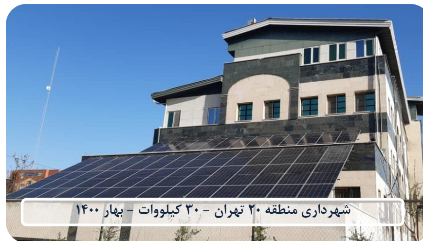
شهرداری منطقه ۲۰ تهران - ۳۰ کیلووات - بهار ۱۴۰۰