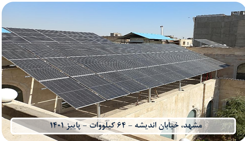
مشهد، خیابان اندیشه - ۶۴ کیلووات - پاییز ۱۴۰۱