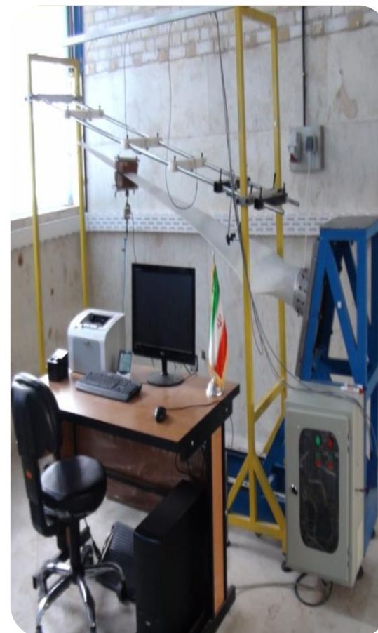
دستگاه آزمون پره توربین بادی کوچک