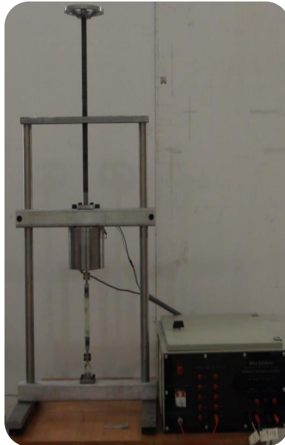
دستگاه تست خستگی برقی فرکانس بالا