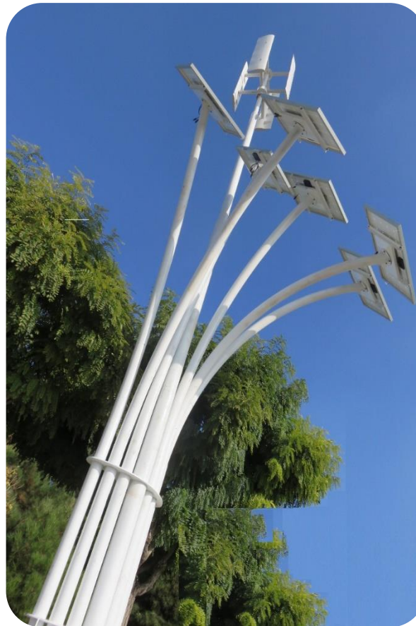
کارفرما: شرکت عمران شهر جدید بینالود ظرفیت: ۱ کیلووات - سال ۱۳۹۴