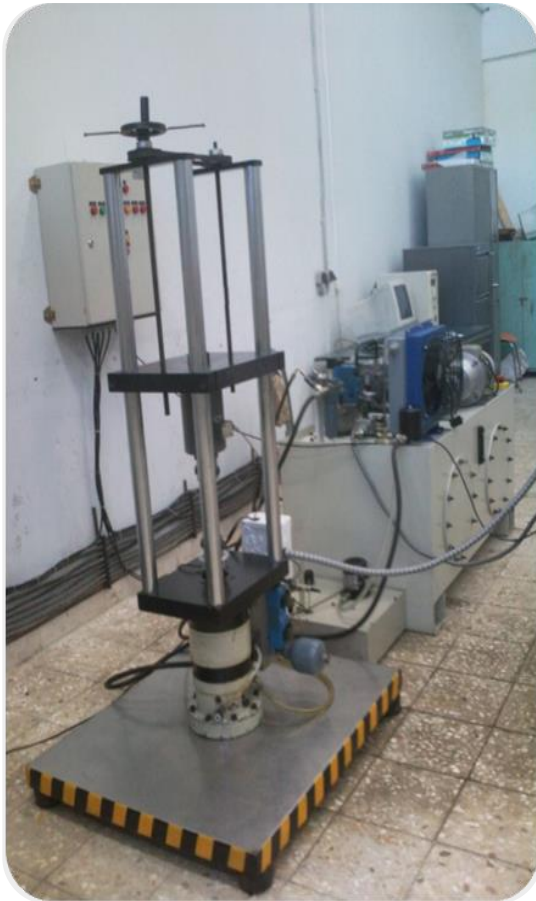
دستگاه تست خستگی سرو هیدرولیک