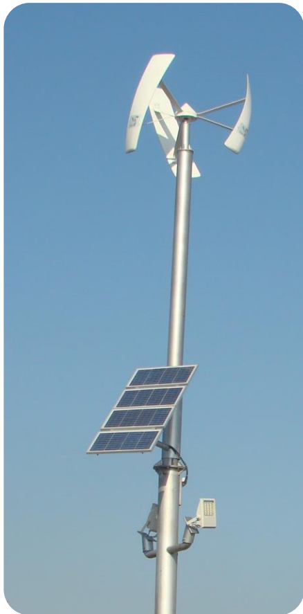
کارفرما: شرکت توزیع برق خراسان شمالی ظرفیت: ۶۲۰ وات - سال ۱۳۹۲