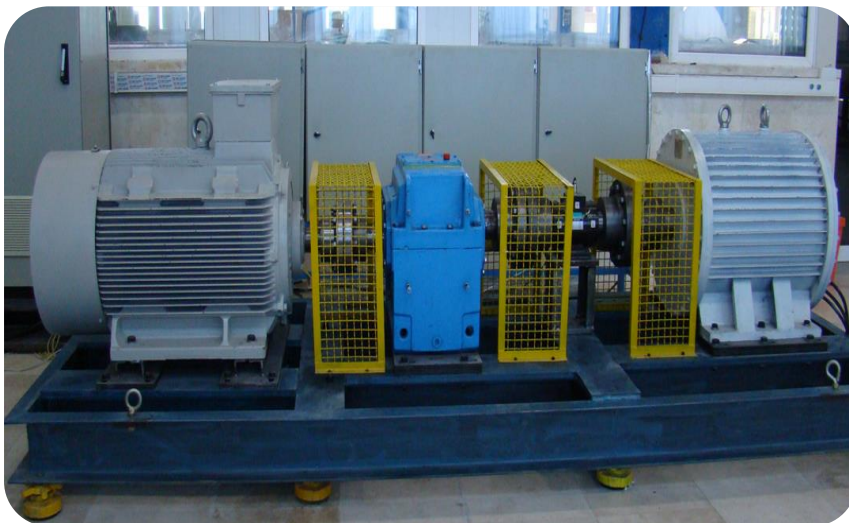
سیمولاتور توربین بادی