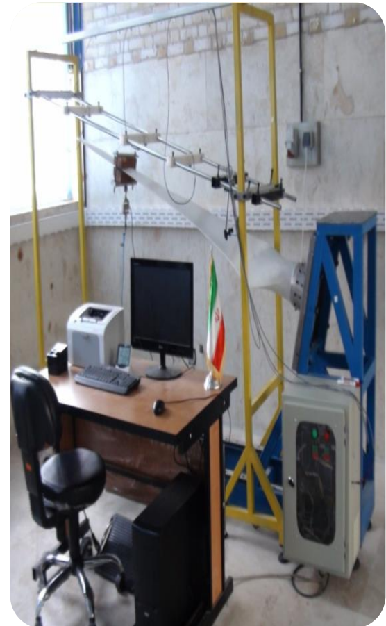
دستگاه آزمون پره توربین بادی کوچک