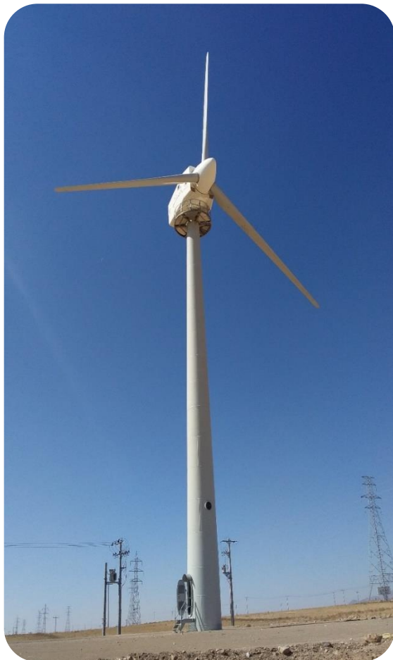
سایت بادی بینالود - توربین بادی ۱۰۰ کیلووات