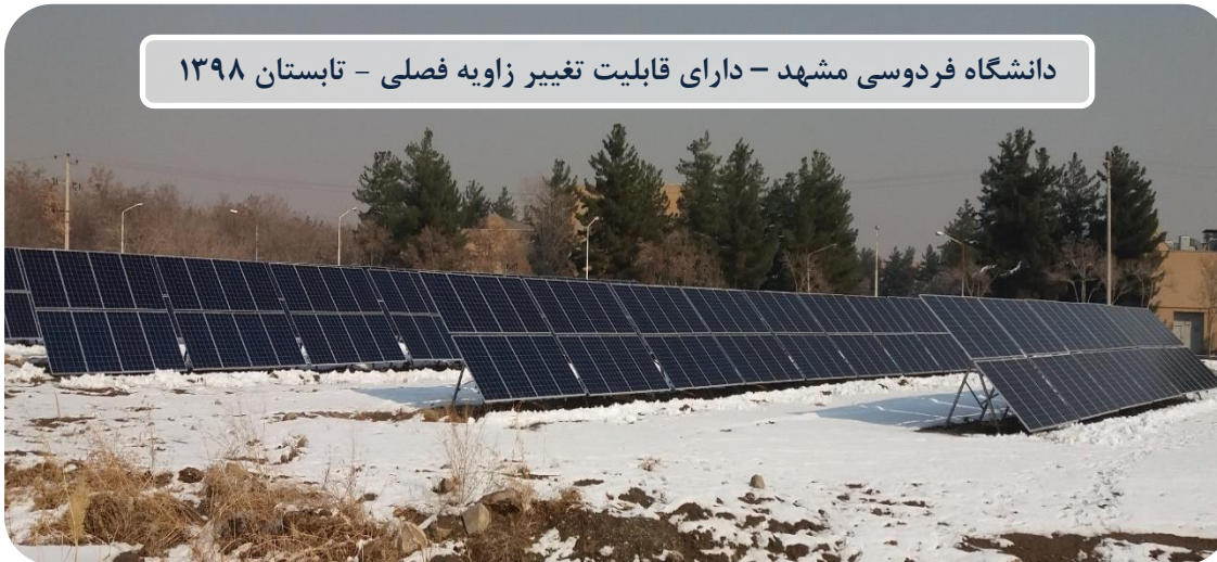
دانشگاه فردوسی مشهد - دارای قابلیت تغییر زاویه فصلی - تابستان ۱۳۹۸