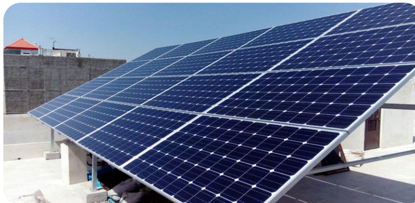
کارفرما: کمیته امداد امام خمینی (ره) استان خراسان رضوی شهرستان‌های تربت حیدریه و رشتخوار - سال ۱۳۹۶