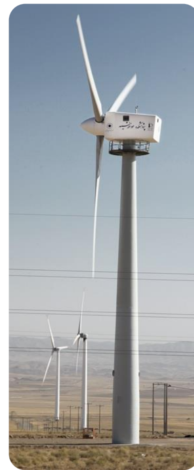
سایت بادی بینالود - توربین بادی ۲۵۰ کیلووات