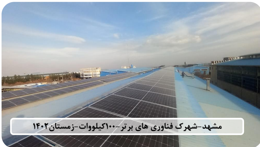
مشهد-شهرک فناوری های برتر-۱۰۰ کیلووات-زمستان ۱۴۰۲